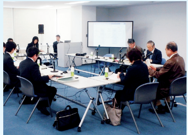
関東地方小委員会の様子

また、家屋への影響、経済性の面でも優れており、意見聴取で得られた地域へのニーズにも応えられる。